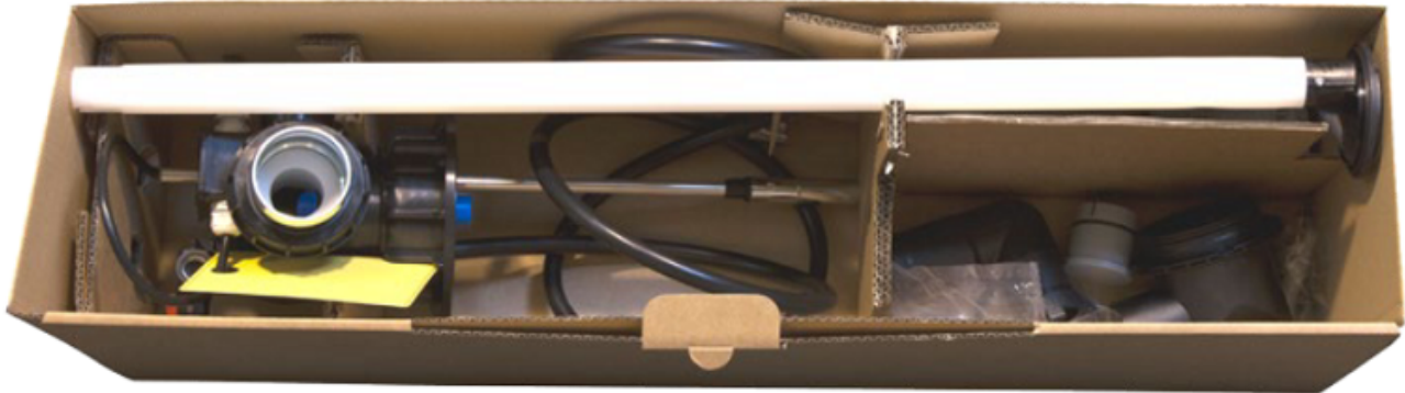
▲ Widok z góry na pakiet podstawowy

lub EC2012P - pakiet rozbudowujący , który kupisz tutaj: