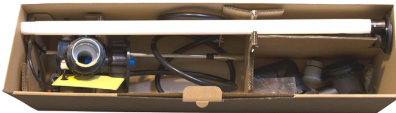
▲ Widok z góry na pakiet podstawowy

lub EC2012P - pakiet rozbudowujący , który kupisz tutaj: