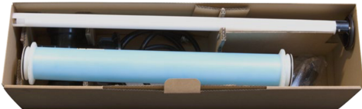
▲ Widok z góry na pakiet rozbudowujący

SCHEMAT ZBIORNIKA OLEJU EUROLENTZ KOMFORT poj. 1000l wraz z pakietem EB2012P