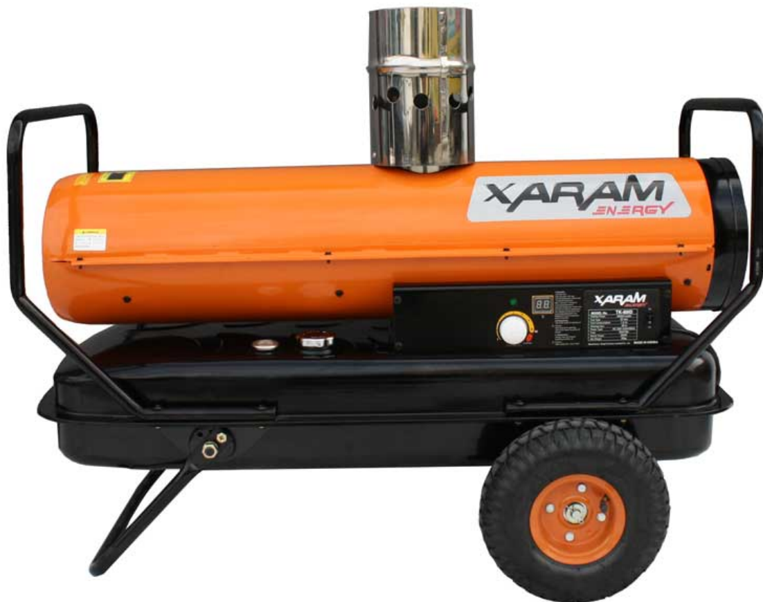
SCHEMAT NAGRZEWNICY OLEJOWEJ Z ZAMKNIĘTĄ KOMORĄ SPALANIA XARAM Energy, TIGER KING model TK-80ID, XF-80ID: