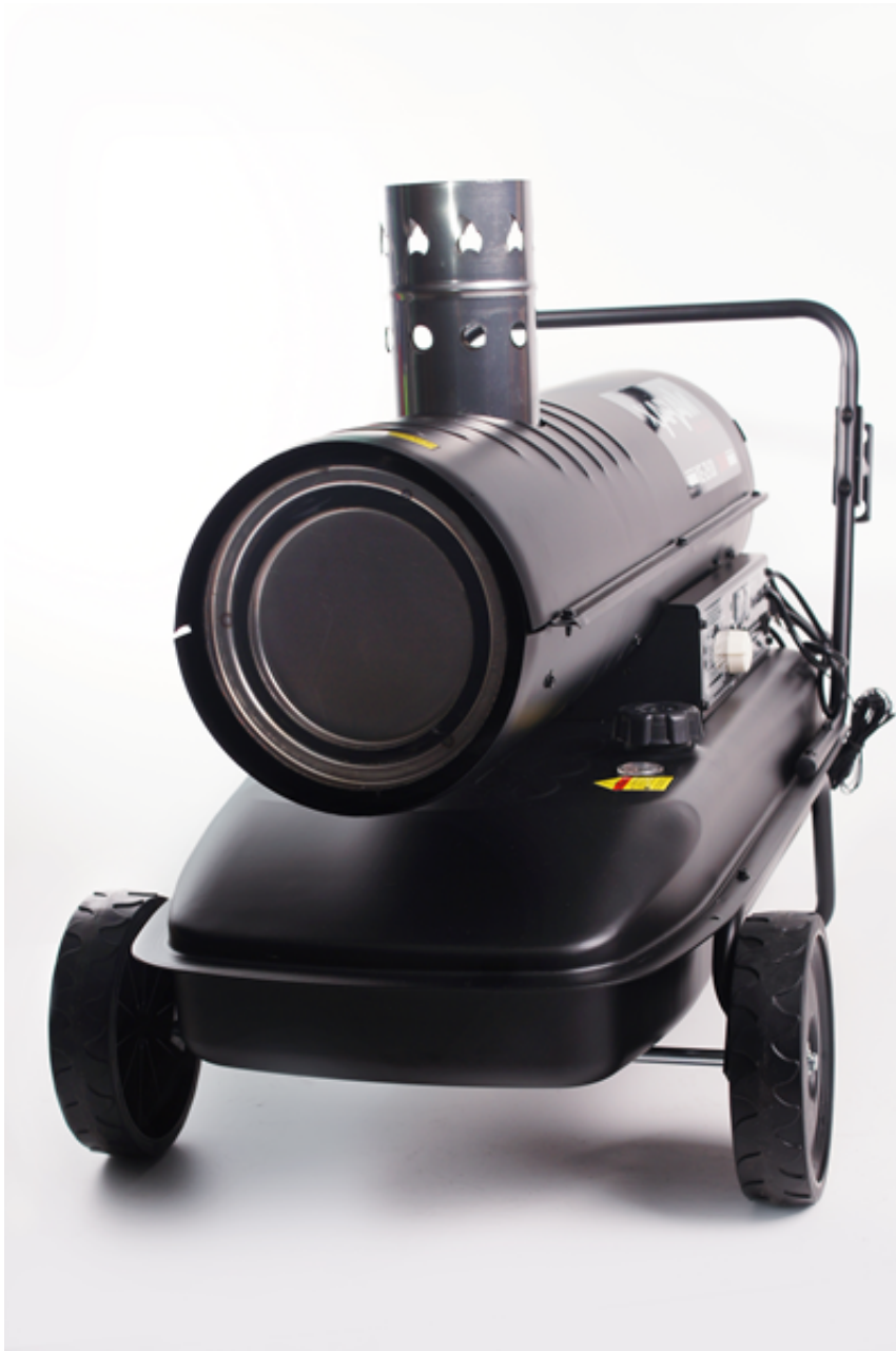
BUDOWA NAGRZEWNICY OLEJOWEJ Z ZAMKNIĘTĄ KOMORĄ SPALANIA XARAM Energy XE-ZH30, moc: 30kW