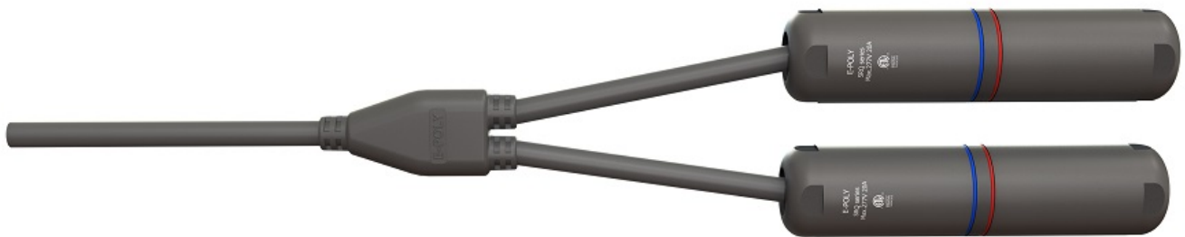
Szybkozłącze hermetyczne SRQ-PT

Najnowocześniejsza technologia sprawia, że w kilka minut może być całkowicie hermetyczne, wodoodporne połączenie dwóch odcinków samoregulującego kabla grzewczego z zasilaniem 230V! Zestaw składający się z dwóch szybkozłączek hermetycznych SRQ-PT :